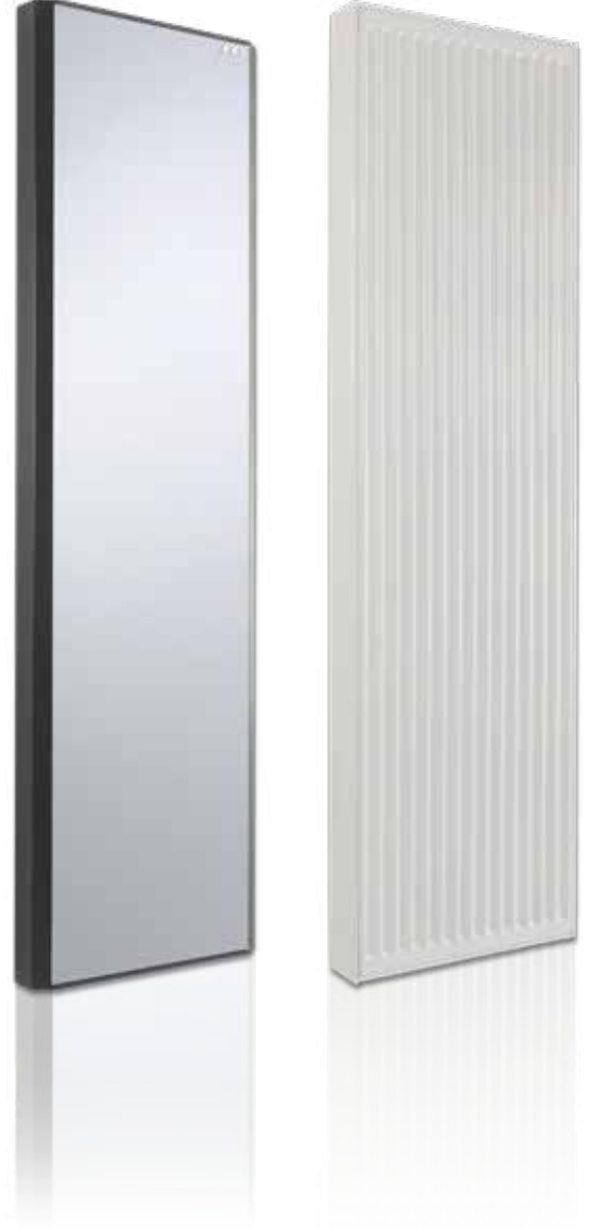
Tip-21 / PKP Dikey Kanallı Dikey Panel Radyatör(TL/Adet)